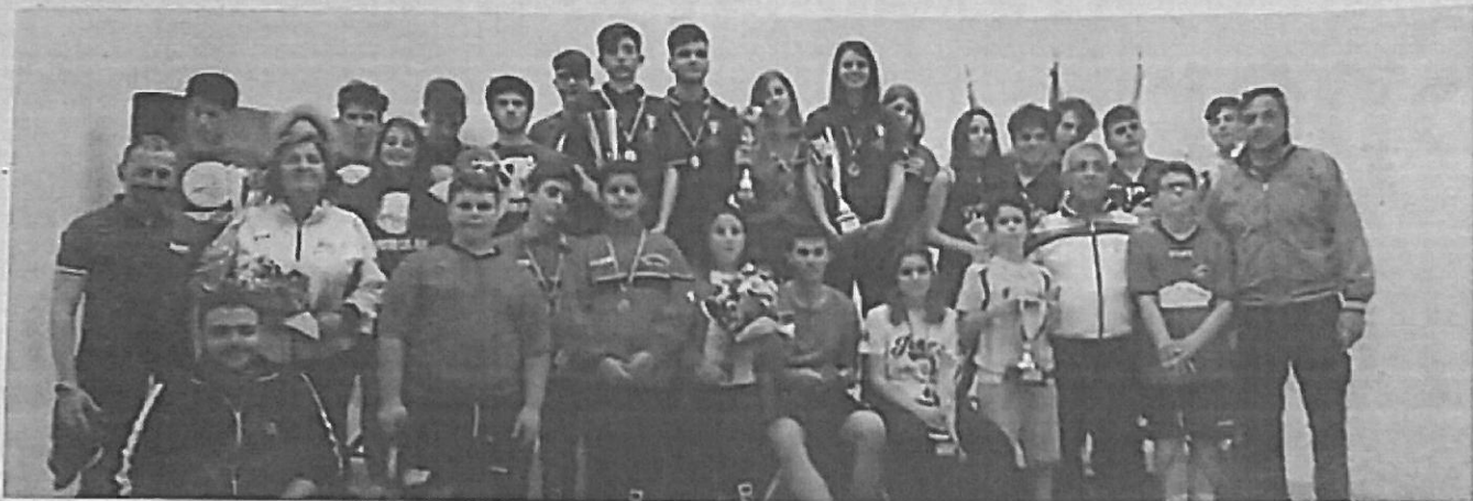
Foto di gruppo di tutti gli atleti calabresi premiati ai campionati Italia Scolastici di Riccione; di fianco al titolo: l'Istituto Istruzione superiore di Castrolibero premiata dal professore Monti

SQUASH Ai campionati italiani Scolastici e Allievi svoltisi a Riccione